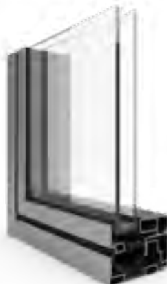
PROFILO A TAGLIO TERMICO

Profilo realizzato in acciaio nella parte interna ed esterna, in quella centrale viene inserita una soletta isolante per aumentarne notevolmente l'isolamento termico.