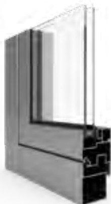
PROFILO A TAGLIO FREDDO

Profilo realizzato interamente in acciaio, destinato all'uso in luoghi che necessitano requisiti termici inferiori come pareti interne o vetrine.